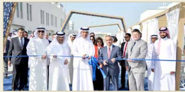
افتتاح مشروع "دانات اللوزي"

في مساعي توفير الخدمات الإسكانية للمواطنين، موضحاً أن الوزارة وفي خط مواز تقوم بجهود متقدمة على صعيد تنفيذ محور مشاريع مدن الحريين الجديدة، وأن تلك المحاور تمثل ركائز الوزارة في تنفيذ البرامج والخطط الحكومية المتعلقة بقطاع الإسكان، متمنياً جهود اللجنة الوزارية للمشاريع والتنمية والبنية التحتية برئاسة الشيخ خالد بن عبدالله آل خليفة في دعم كافة البرامج والخطط الإسكانية، مما ساهم في تلبية آلاف الطلبات الإسكانية خلال فترة زمنية وجيزة. وأضاف أن الوزارة وفي ظل حرصها على تطوير برنامج مزايا تماشياً مع هذا المشروع طرحت 4 مشاريع إسكانية جديدة بالتعاون مع القطاع الخاص، في إطار دعم جهود الوزارة في العمل على توفير مزايا عبر اختصار المدة الزمنية لها من 105 أيام إلى 15 يوماً فقط، من أجل تسريع حصول المواطنين على السكن، مشيراً إلى أن ذلك يأتي في إطار تنفيذ اللوائح، فضلاً عن تصميمة المتنامي مع أحدث تصاميم البناء، مشيراً إلى أن هذا المشروع حظي بإقبال كبير من قبل المواطنين المدرجة طلباتهم على قائمة الانتظار بالوزارة.