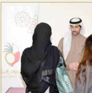
الجامعة الملكية للبيات

الجازة على مدى الدورتين الماضيتين نجاحاً متزايداً تمثل في جودة الأعمال المقدمة سواء على المستوى الفردي أو حتى المستوى الجماعي، الأمر الذي يعكس قيمة العمل التطوعي الشبابي في مملكة البحرين، ورغبة الشباب البحريني من الجنسين في عمل الخير. وتشكل جائزة الشخة حصة بنت سلمان للعمل التطوعي إحدى مبادرات دعم وتعزيز روح العمل التطوعي لدى الشباب في مملكة البحرين، بما يعزز من مجلات العمل التطوعي لدى الشباب البحريني من الجنسين، ويشجعهم على المبادرة والإبداع؛ من أجل تعزيز المبادرة والإبداع؛ من أجل تعزيز العمل التطوعي لدى الشباب في مجال الشرب تاريخياً، وكان سبباً في إزدها مجتمعها المدني.