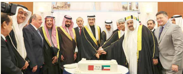
نيابة عن سمو رئيس الوزراء... سمو الشيخ خليفة بن علي يحضر حفل السفارة الكويتية

نيابة عن سمو رئيس الوزراء وبمناسبة العيد الوطني ويوم التحرير