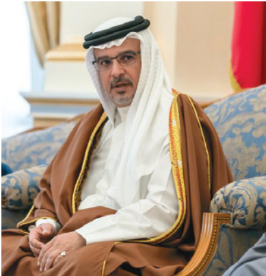
الملك ولي ولي العهد نائب القائد الأعلى النائب الأول لرئيس مجلس الوزراء علي ما يوليه سموه من حرص على صحة وسلامة المواطنين والمقيمين.

أكد صاحب السمو الملكي الأمير سلمان بن حمد آل خليفة ولي العهد نائب القائد الأعلى النائب الأول لرئيس مجلس الوزراء استمرارية مملكة البحرين في تعزيز جهودها الرامية إلى الحفاظ على صحة وسلامة المواطنين والمقيمين، عبر ما اتخذته من إجراءات احترازية وتدابير للوقاية من فيروس كورونا (كوفيد 19). ونوه سموه أن الجهات المعنية تتخذ كافة الإجراءات لمكافحة الفيروس ومنع انتشاره، مع إعلان أول حالة إصابة بفيروس كورونا في المملكة، والعمل مستمر لتكثيف الإجراءات الاحترازية والوقائية وفقاً للمعايير الدولية لمواجهة فيروس كورونا (كوفيد 19)، والالتزام بطرق الوقاية للحماية من الفيروس، مشدداً على ضرورة التزام الجميع بالمسؤولية المشتركة والتعاون مع مختلف الجهات لاتباع كافة التعليمات من مصادرها الرسمية، للوقاية من فيروس كورونا (كوفيد 19). والتقى سمو ولي العهد بمجلسه بخصر القضية بحضور نائب رئيس مجلس الوزراء، سمو الشيخ محمد بن مبارك آل خليفة، الإثنين، رئيس مجلس النواب، فوزية زينل، ورئيس مجلس الشورى، علي الصالح، ونائب رئيس مجلس الوزراء، الشيخ خالد بن عبدالله آل خليفة، ورئيس غرفة تجارة وصناعة البحرين، سميح ناس، وعدد من الوزراء وأعضاء مجلسي الشورى والنواب، حيث أعرب سموه عن الشكر والتقدير لرئيسي وأعضاء مجلسي الشورى والنواب على ما يقدمونه من جهود وطنية هدفها رفعة ونماء الوطن وعلى ما يبذلونه من تعاون بناء مع السلطة التنفيذية والذي كان له الأثر فيما يتحقق من منجزات ومشاعر تخدم الوطن والعملية التنموية في مملكة البحرين. من جانبهم أعرب الحضور عن شكرهم وتقديرهم لصاحب السمو