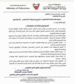
تعميم الإرشادات الصحية

مدينة عيسى - وزارة التربية والتعليم أصدرت وزارة التربية والتعليم تعميماً إلى المدارس الحكومية والخاصة مع بداية الفصل الدراسي الثاني، بشأن التعليمات والإرشادات الواجب اتباعها للحفاظ على البيئة المدرسية، ومنها على وجه الخصوص ضرورة المحافظة على النظافة في المباني والصفوف والمساحات والمرافق الصحية وتقنها باستمرار، وتوعية الطلبة بأهمية النظافة الشخصية، والالتزام بنظافة البيئة المدرسية وتقديم برامج توعوية صحية ووضع الإعلانات الإرشادية، والالتزام بتنفيذ الإجراءات المعتادة عند تعرض أي طالب لوعكة صحية بإعلام ولي الأمر وأقرب مركز صحي تتعامل معه المدرسة، بالإضافة إلى إعلام الإدارة التعليمية عند الضرورة حفاظاً على سلامة الجميع. يأتي ذلك في إطار الجهود التي تبذلها الوزارة لجعل البيئة المدرسية بيئة تعليمية آمنة.