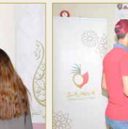
جامعة (AMA) الدولية