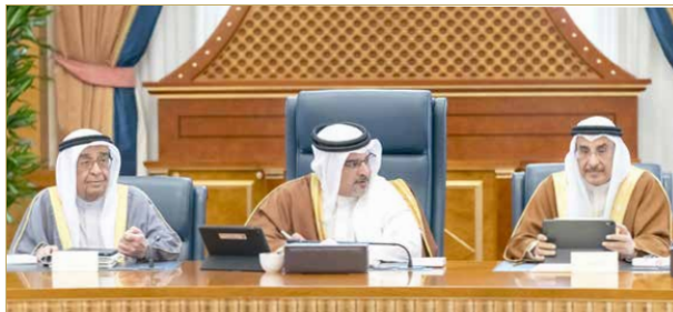
سمو ولي العهد يترأس جلسة مجلس الوزراء

متابعة تنفيذ توجيهات سمو رئيس الوزراء بسرعة توظيف الأطباء العاطلين