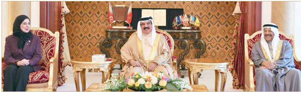
جلالة الملك مسقياً رئيسي مجلسي النواب والشورى

جلالته: التاريخ يشهد بترباط وتكاتف أهل البحرين