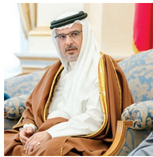
○ سمو ولي العهد.

«السلطة التشريعية ترسخ دعائم المسيرة الوطنية الديمقراطية» (التفاصيل من ٥)