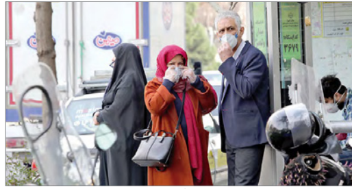
مواطنون إيرانيون يلبسون الأقنعة خوفاً من عدوى فيروس كورونا.

سلامة المواطنين من الإصابة بفيروس كورونا. ودعت وزارة الخارجية المواطنين المتواجدين في البلدان للتواصل مع السفارة أو مع مركز الاتصال بالوزارة، حسب ما أشارت وكالة أنباء الإمارات. وقالت وزارة الخارجية والتعاون الدولي في بيان اليوم أنه «في ظل جهود الدولة لمواجهة انتشار فيروس الالتهاب الرئوي الجديد كورونا في عدد من الدول، وحرصاً من وزارة الخارجية والتعاون الدولي على سلامة وصحة المواطنين، تقرر منع سفر مواطني الدولة لكل من جمهورية إيران ومملكة تايلاند في الوقت الحالي وحتى إشعار آخر.» قالت وسائل إعلام إيطالية أمس الإثنين، إن شخصين توفيا إثر إصابتهما بفيروس كورونا، يرتفع عدد الضحايا إلى 6 أشخاص. وتكررت وسائل إعلام إيطالية أن أحد الضحايا كان في الثامنة والثمانين من العمر من منطقة لومبارديا. وكان الأربعة الآخرون الذين توفوا بالمرض من المسنين أيضاً، وثلاثة منهم على الأقل كانوا يعانون من مشكلات صحية خطيرة أخرى.