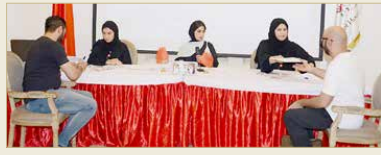
تسليم شهادات شقق التمليك بمدينة سلمان الواقعة بالمحافظة الشمالية

صحية وعيادات، ومدينة رياضية تضم استاد كرة قدم، بالإضافة إلى الحدائق المفتوحة، فضلاً عن تصميمها الداخلي الذي يأتي ضمن التصاميم الحديثة للجيل الخاص للعائلات السكنية التي تنفذها الوزارة في المدن الإسكانية الجديدة ومشاريع المجمعات السكنية بمحافظات المملكة. ونوه الوكيل المساعد للسياسات والخدمات الإسكانية بوزارة الإسكان إلى أن توزيع وحدات مدينة سلمان يعد من المشاريع الإسكانية التي تقوم الوزارة بتوطينها في إطار البرنامج الزمني للوزارة لتنفيذ أمر سمو ولي العهد بتوزيع 5000 وحدة سكنية، موزعة على مشاريع مدن الحريين الجديدة ومشاريع المجمعات السكنية في محافظات المملكة.