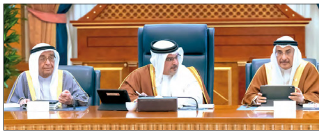
سمو ولي العهد مترشّحاً لمجلس الوزراء أمس

بحث مجلس الوزراء برئاسة صاحب السمو الملكي الأمير سلمان بن حمد آل خليفة ولي العهد نائب القائد الأعلى النائب الأول لرئيس مجلس الوزراء آخر التطورات والمستجدات حول فيروس كورونا (كوفيد 19)، وذلك في ضوء تسجيل أول حالة إصابة بالفيروس في البحرين لمواطن قادم من إيران عبر دبي.