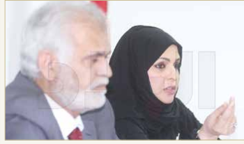
من جلسة بلدي الشمالي

«طلبات» و«كاريج»، إلا أن الكلفة العالية تصل إلى دينارين لتوصيل حزمة واحدة من أكياس القمامة، وستحل مشكلة الصرف.