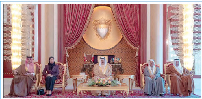
جلالة الملك خلال استقباله رئيسي مجلسي النواب والشورى