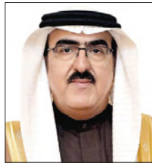
د. ياسر الناصر

رابعاً: وافق مجلس الوزراء على مذكرة تفاهم بشأن برنامج العمل التنفيذي بين وزارة المواصلات والاتصالات بمملكة البحرين والهيئة العامة للطيران المدني بولاية الإمارات العربية المتحدة، والهادفة إلى تعزيز التعاون بين البلدين الشقيقين في مجالات تقديم خدمات ونظم الملاحة الجوية ودعم التواحي الفنية والتشغيلية بينهما.